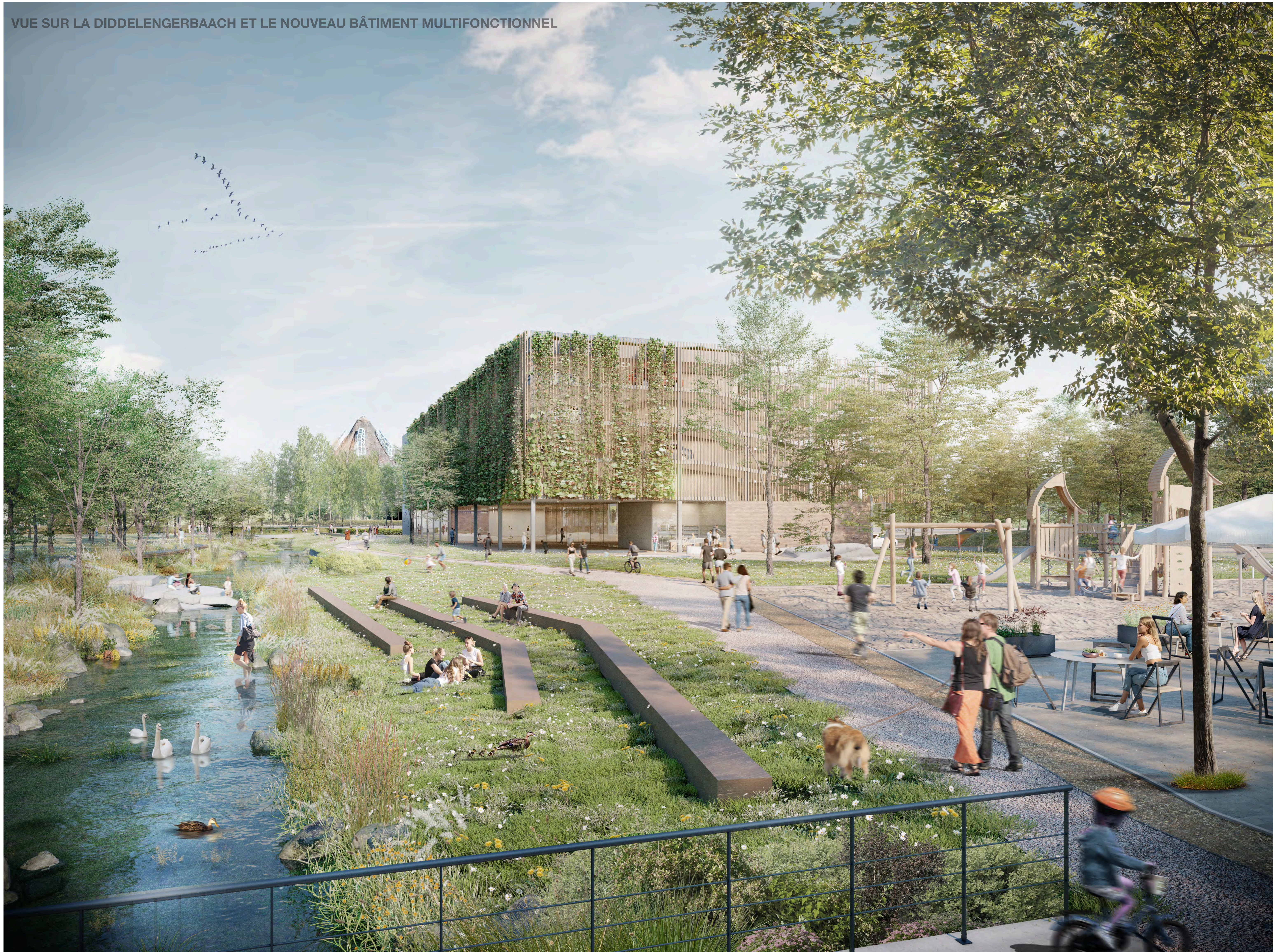
VUE SUR LA DIDDELENGERBAACH ET LE NOUVEAU BÂTIMENT MULTIFONCTIONNEL