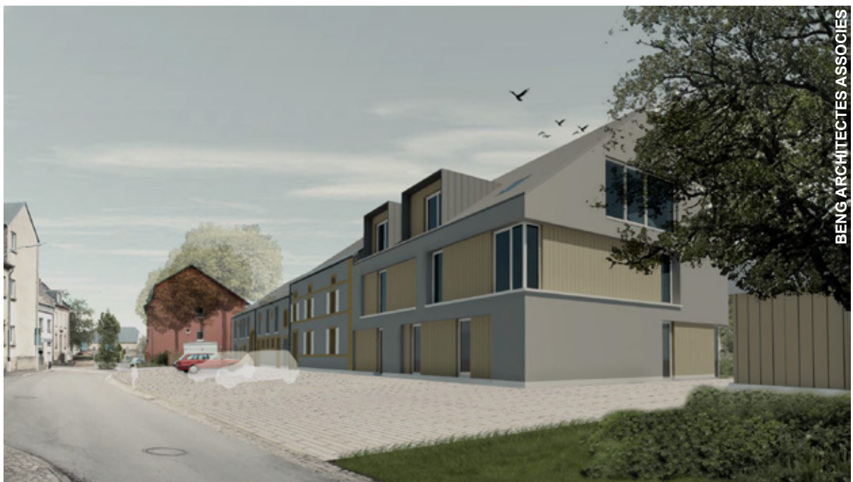
Vue côté rue