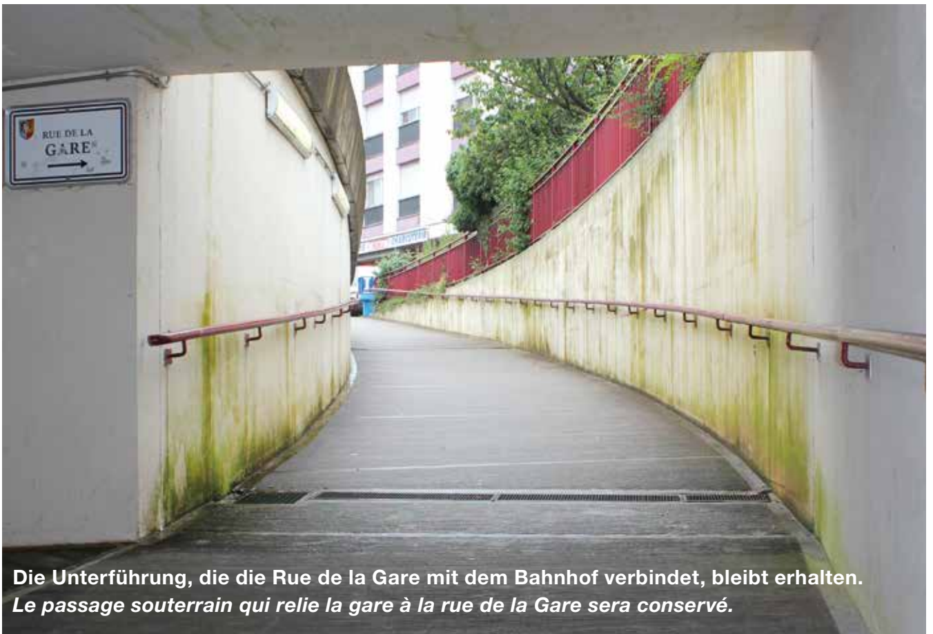
Die Unterführung, die die Rue de la Gare mit dem Bahnhof verbindet, bleibt erhalten. Le passage souterrain qui relie la gare à la rue de la Gare sera conservé.